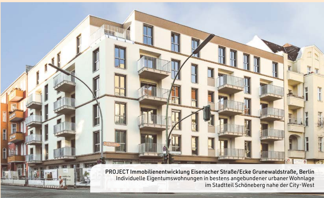
PROJECT Immobilienentwicklung Eisenacher Straße/Ecke Grunewaldstraße, Berlin Individuelle Eigentumswohnungen in bestens angebundener urbaner Wohnlage im Stadtteil Schöneberg nahe der City-West