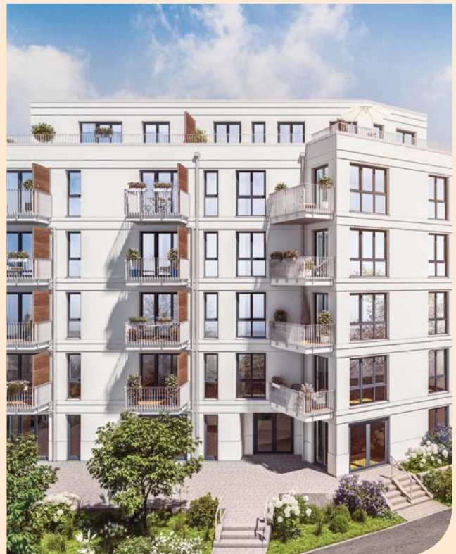
Rosenthaler Weg 50, Berlin Pankow