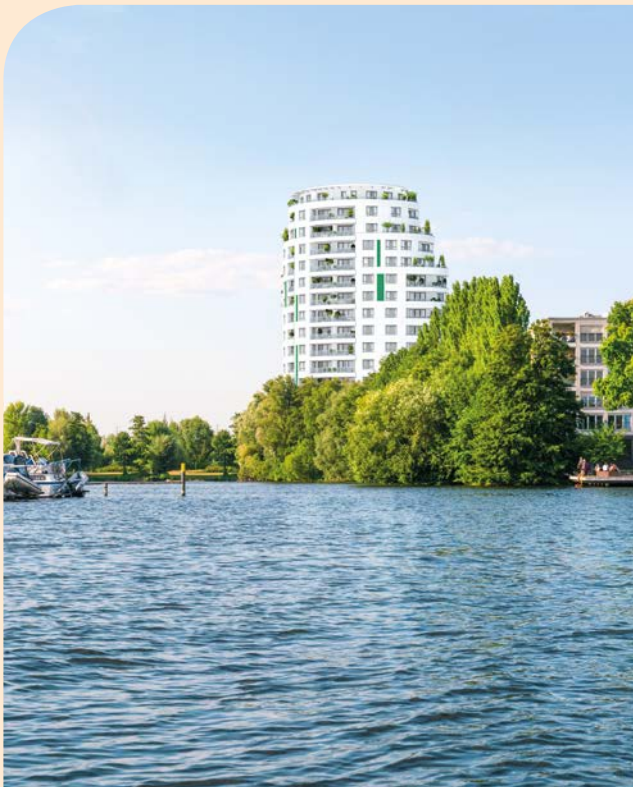
Hugo-Cassirer-Straße/An der Havelspitze, Berlin Spandau

Der überwiegende Objektanteil befindet sich nach Ankauf noch in der Planungsphase. Hier wird intensiv an der Genehmigungsplanung gearbeitet, um mit Erteilung der Baugenehmigung zügig die Vermarktung und weitere Realisierung starten zu können. In Steglitz-Zehlendorf ist im zweiten Halbjahr das Berliner Wohnobjekt Potsdamer Chaussee in die Vermarktung gegangen und der Baubeginn wird vorbereitet. Vertriebsstart war ebenfalls beim Wohnbauvorhaben Rosenthaler Weg in Berlin-Pankow. Bei sehr guten Verkaufsquoten laufen die Rohbauarbeiten an der Fürther Straße in Nürnberg und bei der im Innenausbau befindlichen Wohnanlage in der Berliner Hugo-Cassirer-Straße konnte der Verkauf erfolgreich abgeschlossen werden.