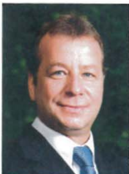
Frank Balzer Bezirksbürgermeister

Aus 37 Vorschlägen hat das Preisgericht 5 Bauherrenpreise und 6 Belobigungen in den verschiedenen Kategorien ausgewählt. Die nachfolgende Präsentation der prämierten Projekte soll Beispiel und Anregung sein, die bauliche Entwicklung und städtebauliche Qualität des Bezirkes Reinickendorf auch zukünftig aktiv zu unterstützen.