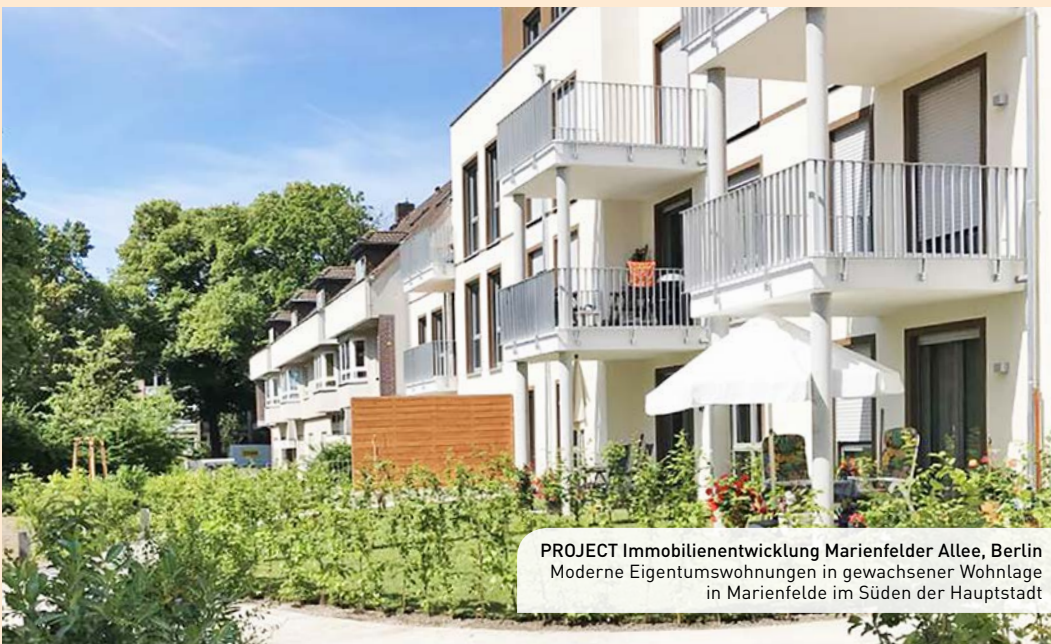
PROJECT Immobilienentwicklung Marienfelder Allee, Berlin Moderne Eigentumswohnungen in gewachsener Wohnlage in Marienfelde im Süden der Hauptstadt