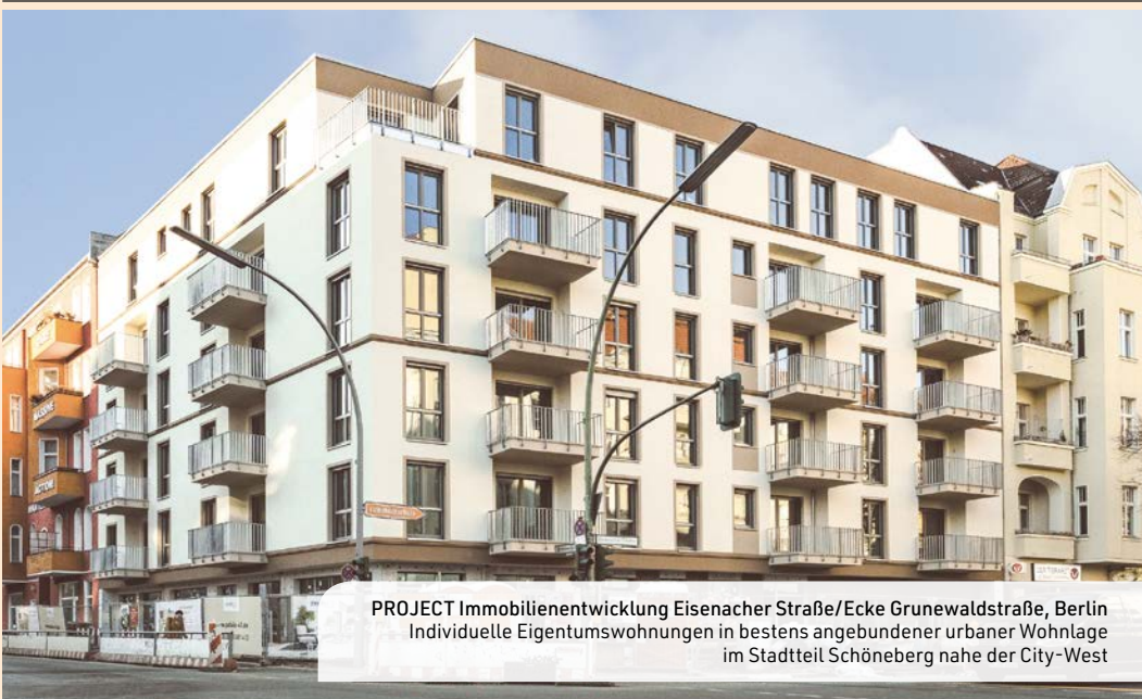
PROJECT Immobilienentwicklung Eisenacher Straße/Ecke Grunewaldstraße, Berlin Individuelle Eigentumswohnungen in bestens angebundener urbaner Wohnlage im Stadtteil Schöneberg nahe der City-West